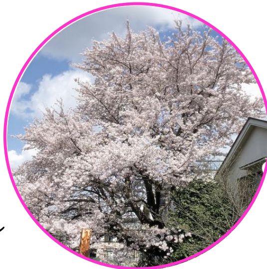
病院の近くの満開の桜