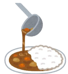
22日 カレーライスの日